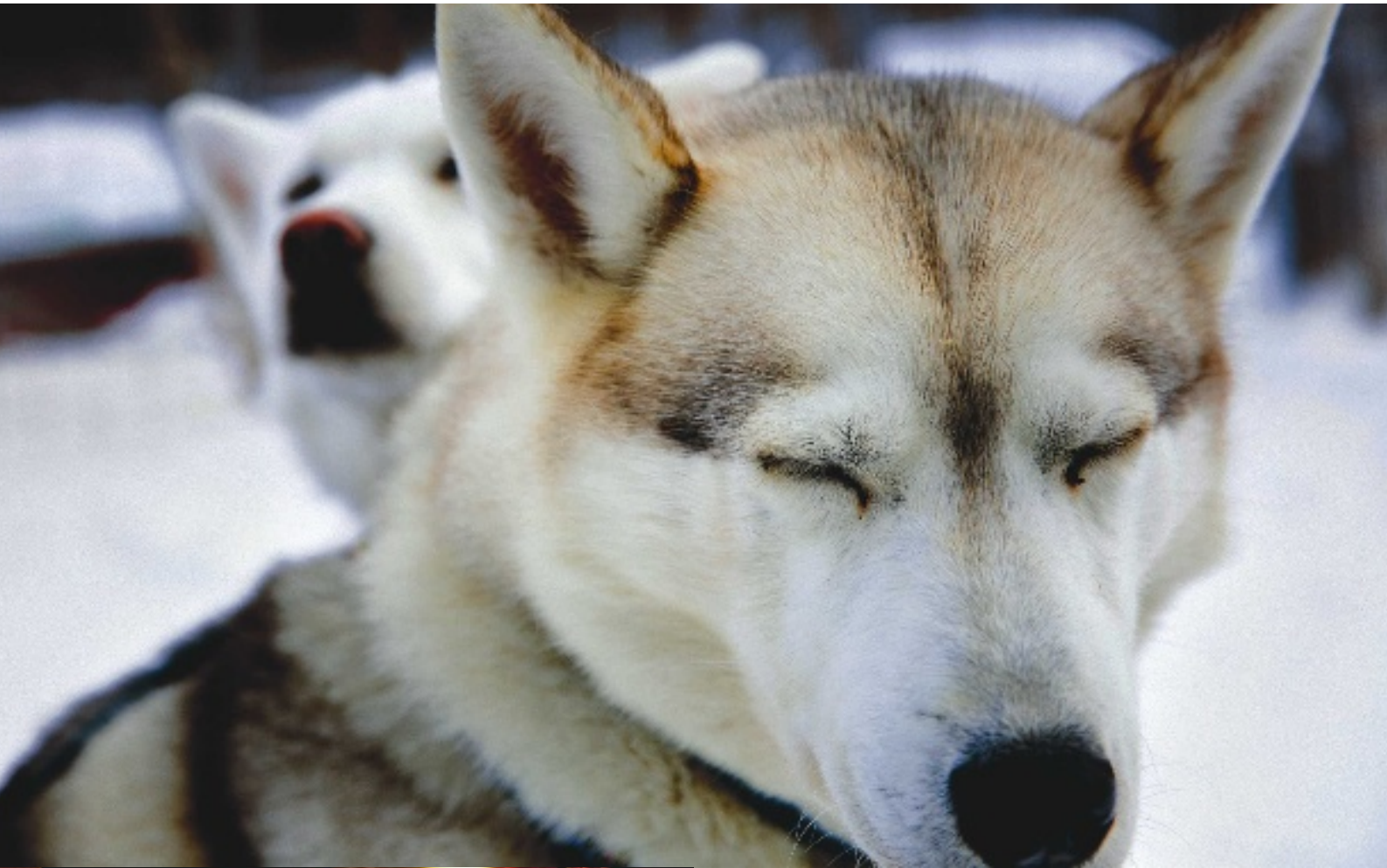
Heiß und kalt: Husky vor dem Start der Hundeschlitten-Tour. Im Schnee dampft der Badezuber, dahinter die Sauna. Lagerfeuer mit Stockbrot auf dem Idresee. Und abends wird's gemütlich: Entspannung in der Hütte