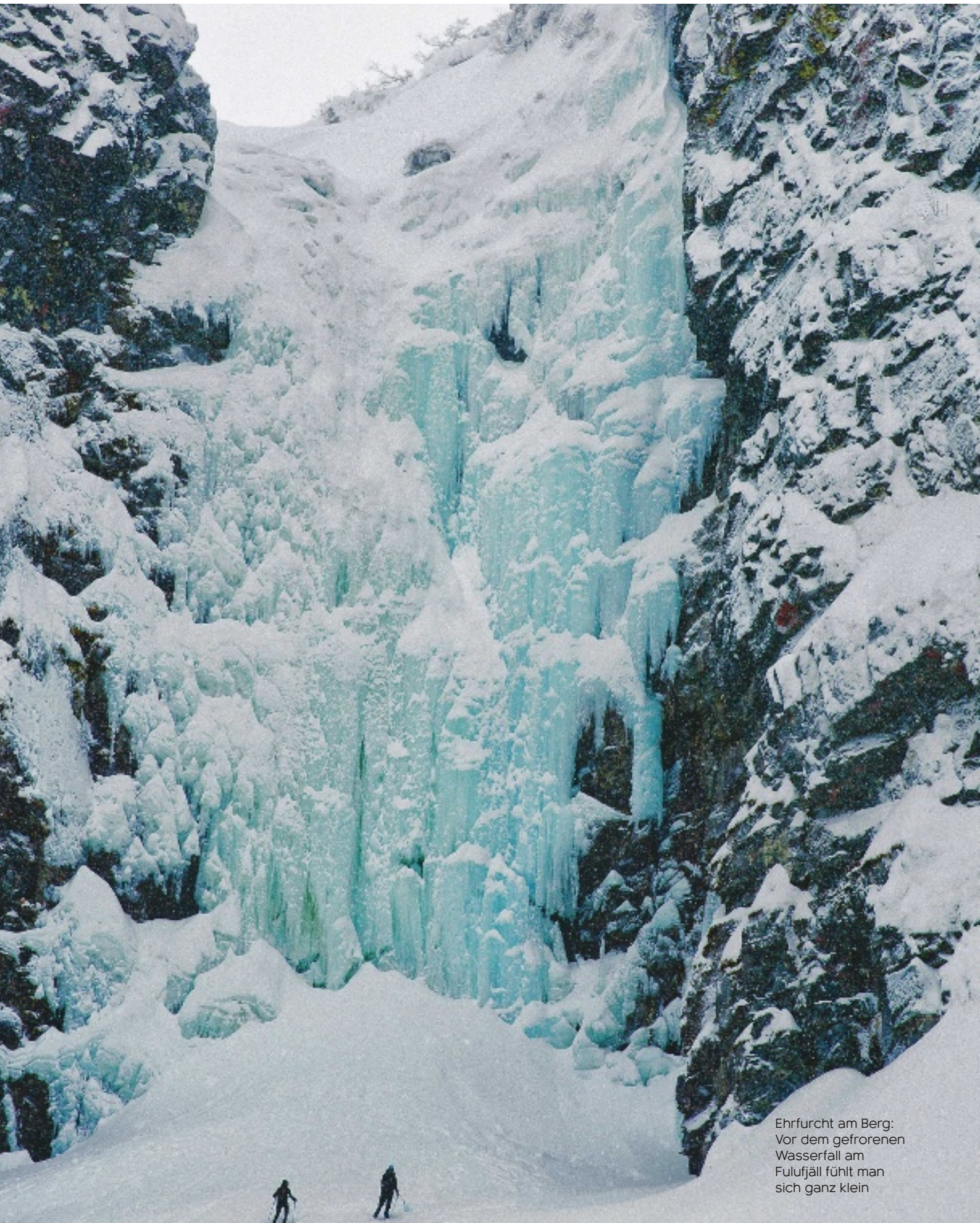
Ehrfurcht am Berg: Vor dem gefrorenen Wasserfall am Fulufjäll fühlt man sich ganz klein