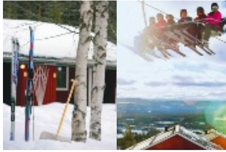
Wir haben kurz Pause: Langlaufski warten im Camp auf ihre Besitzer; Abfahrtski schweben in luftiger Höhe über das Skigebiet am Idre Fjäll und die Ausläufer des Dorfes

S chlange stehen am Skiverleih, an der Gondelbahn, am Lift. Party-People im Schnee, rund um die Uhr. Und Skifahrer, voll mit Jagertee, die mir einmal zu oft einen Schrecken eingejagt haben: Ich bin durch mit dem typischen Skiurlaub. Mich vom Wintersport ganz verabschieden, das will ich aber auch nicht. Dazu ist es einfach viel zu schön, sich in Winterlandschaften zu bewegen: in klarer, kalter Luft, mit wunderbaren weißen Ausblicken. Also mache ich mich auf nach Schweden, ins Naturparadies mit Schneegarantie – auf der Suche nach Wintersportarten jenseits von Abfahrtspisten. Und nach Urlaub auf Schweden-Art, in der Gruppe, gemütlich und naturverbunden