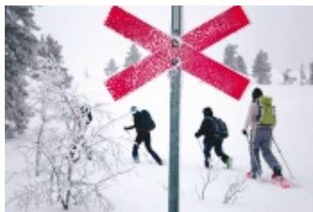
Immer den anderen hinterher: Nur der Erste muss den richtigen Weg finden. Das rote Kreuz weist ihn selbst in tiefstem Schnee

Das Winter-Aktivcamp im mittelschwedischen Idre (Region Dalarna) ist für Einsteiger als auch begeisterte Wintersportler ideal. Jeden Tag hat man die Möglichkeit, sich zum nahe gelegenen Skigebiet shuttleln zu lassen oder an wechselnden geführten Touren auf Langlauf-, Tourenski, Schneeschuhen oder Hundeschlitten teilzunehmen. Auch einige Abfahrtspisten gibt es vor Ort, die passende Ausrüstung im nahe gelegenen Sportgeschäft. Neun Nächte in der Vier-Personen-Schwedenhütte kosten ab 859 Euro, im DZ ab 949 Euro, inklusive VP und Anreise im Reisebus ab Hamburg. Zu buchen bei Rucksack Reisen, Tel. 02 51-87 18 80, www.rucksack-reisen.de . Mehr Infos: visitidre.se